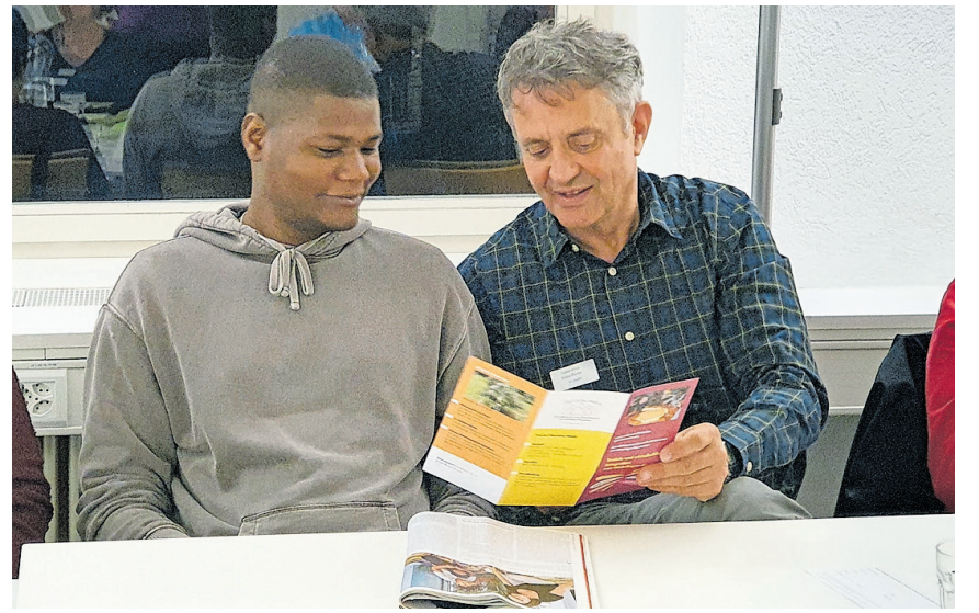
Die Tandem-Partner treffen sich in der Regel einmal pro Woche.

Weitere Auskünfte: zRächtCho NWCH, Gallenweg 8, 4133 Pratteln www.zraechtcho.ch Tel. 061 823 73 24, Tel. 079 109 60 25 kontakt@zraechtcho.ch